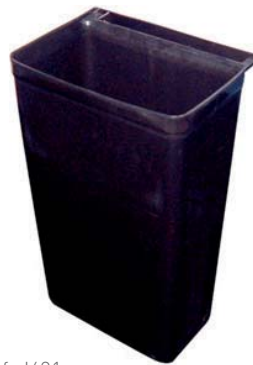
Ref. J691 Cubeta para residuos