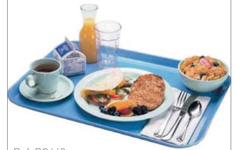
Ref. RC642 Ref. RC643 Ref. RC644 Ref. RC645