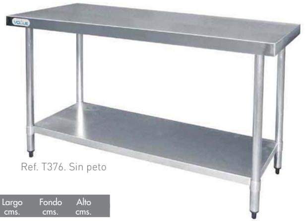
Ref. T376. Sin peto