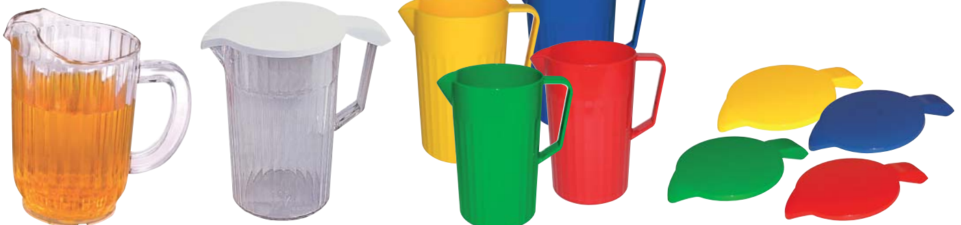
JARRA RETENEDORA Ref. D838 Ref. D837