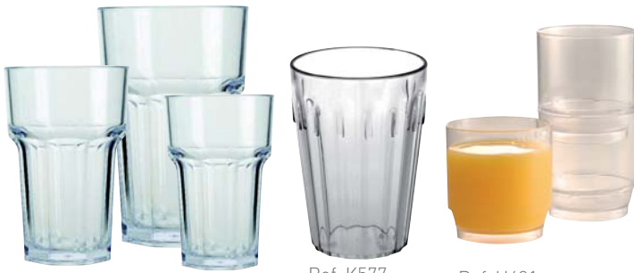
Ref. U407 Ref. U408