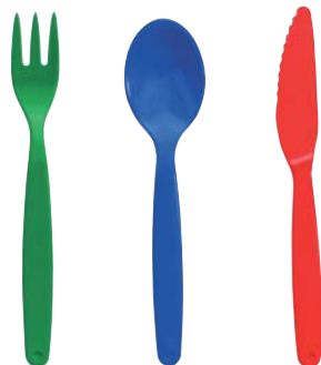
Ref. DL11T Ref. DL12C Ref. DL11C