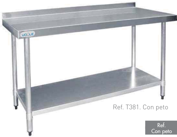
Ref. T381. Con peto

Encimera fabricada en acero inoxidable. Estante inferior y patas de acero galvanizado.