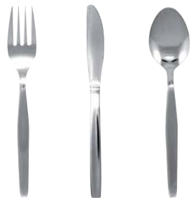
Ref. CB064 Ref. CB065 Ref. CB066