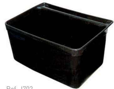
Ref. J702 Cubeta para cubiertos

Fabricado en polipropileno. Dotado de 4 ruedas pivotantes silenciosas. Capacidad de carga máxima 68 kg. (RC1344) y 90.7 kg. (RC1345).